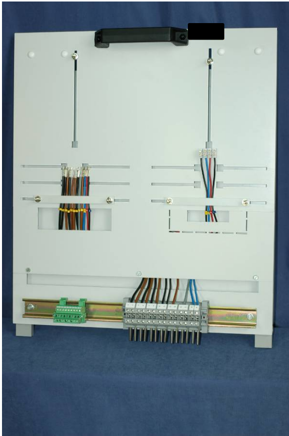
Abbildung 1 Zählerwechselplatte

Höhe: 535 mm Breite: 480 mm Tiefe: 25 mm