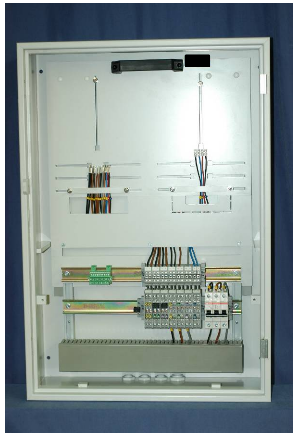
Abbildung 2 Schutzisolierter Zählerschrank mit Zählertafel

Höhe: 800 mm Breite: 550 mm Tiefe: 225 mm